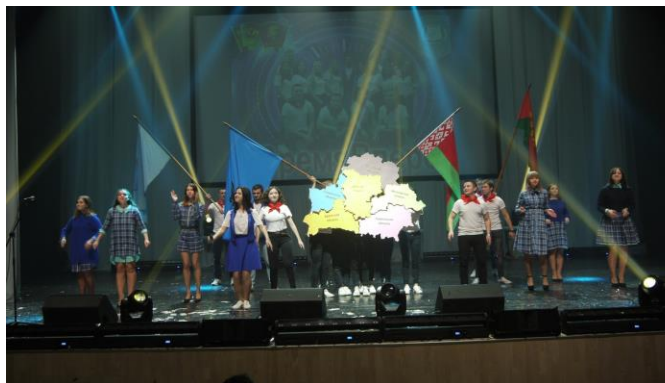
Областной форум студенческих талантов «Зимняя радуга – 2018»