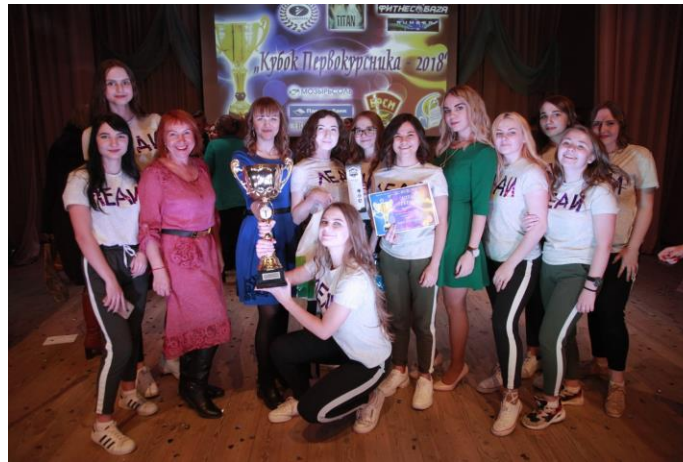
Конкурс «А ну-ка, первокурсник – 2018»