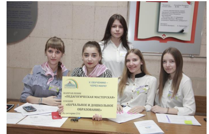
Педагогическая мастерская – 2019