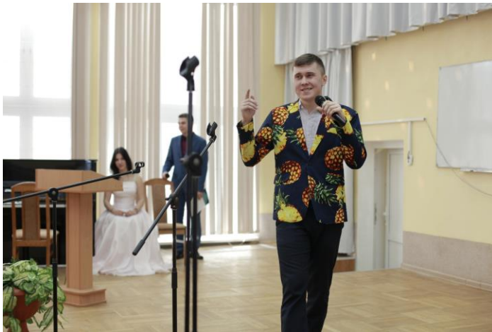
Конкурс «Мистер университет – 2019»

К услугам обучающихся на факультете – общежитие, специализированные кабинеты и лаборатории, позволяющие раскрыть творческие способности на основе выполнения курсовых и дипломных работ, связанных с реальной учебной и производственной практикой.