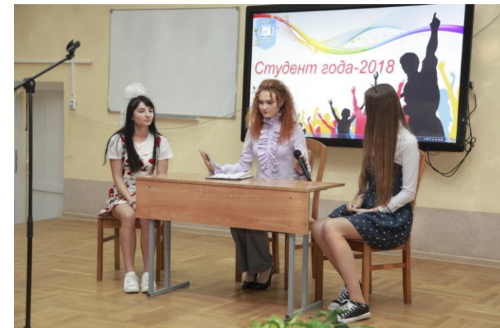
Студент года – 2018