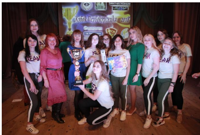
Конкурс «А ну-ка, первокурсник – 2018»