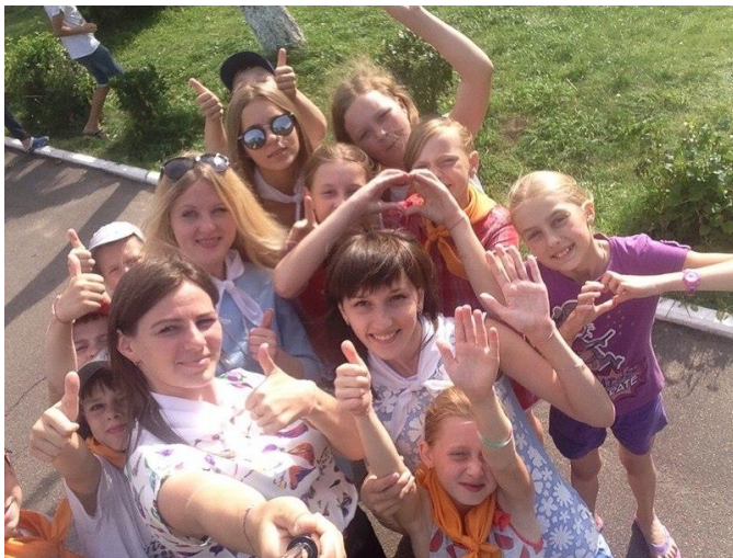
В летнем лагере

Сегодня выпускник факультета дошкольного и начального образования – разносторонне развитая личность, владеющая общенаучными и профессиональными знаниями, актуальными проблемами педагогики и психологии, современными педагогическими и информационными технологиями.