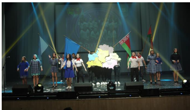
Областной форум студенческих талантов «Зимняя радуга – 2018»