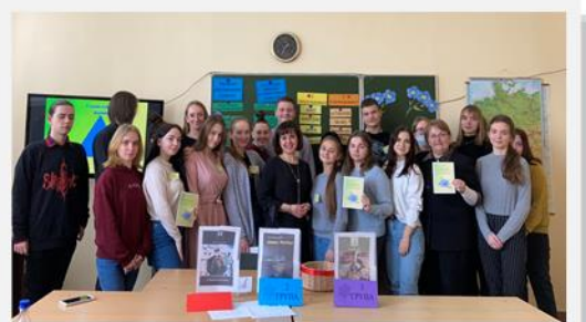
Мастер-класс по языкознанию