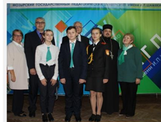
Туrowsкие епархиальные образовательные чтения