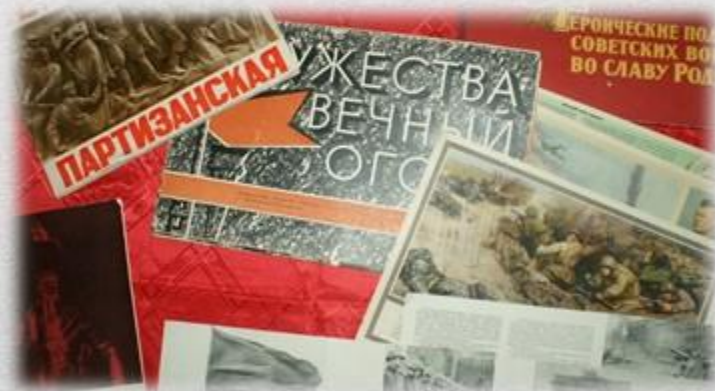
Вахта памяти, посвященная 75-летию Победы в годы Великой Отечественной войны, 7 мая 2020 г., г. Мозырь, Гомельская обл.