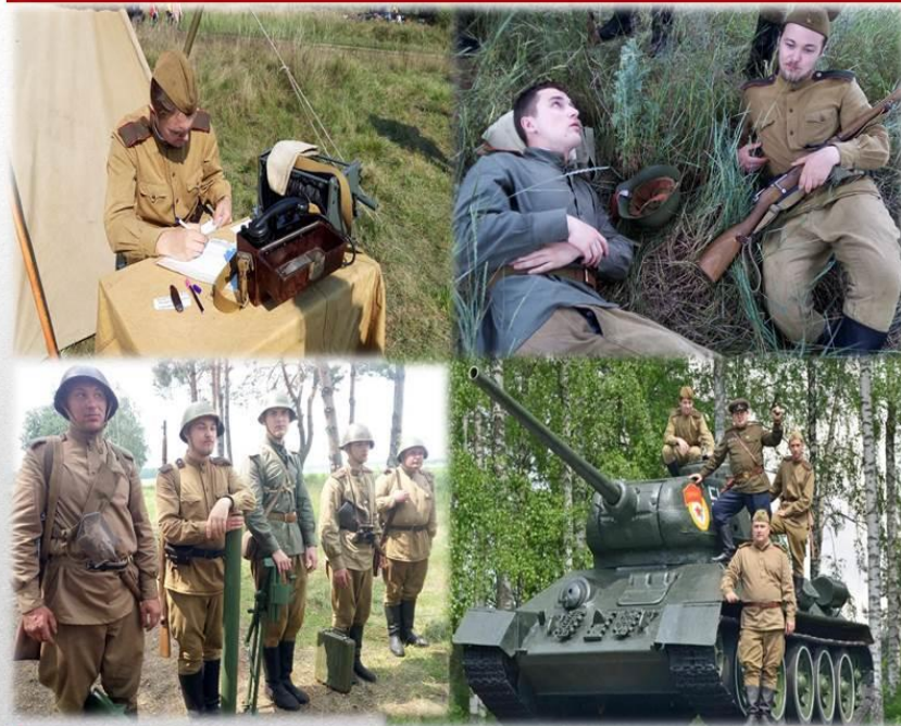
Военно-историческая реконструкция «Операция Багратион», 23 июня 2020 г., д. Раковичи, Гомельская обл.