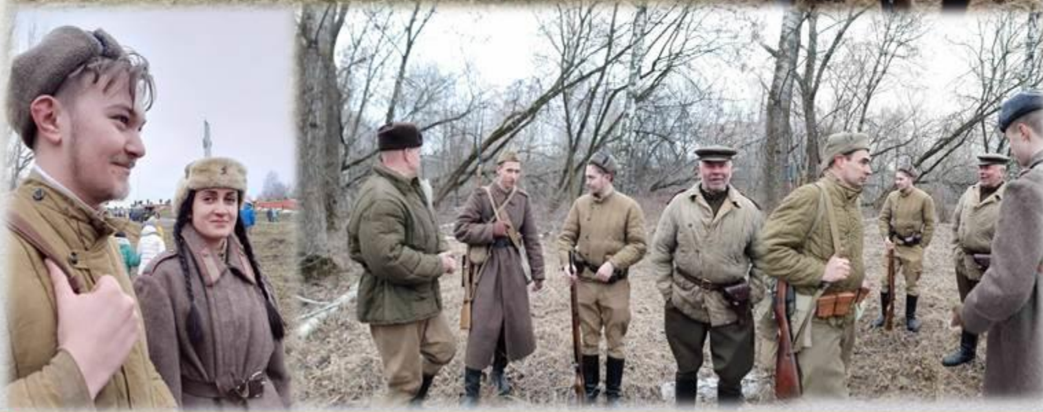
Военно-историческая реконструкция «Последний день войны», 14-15 февраля 2020 г., г. Мозырь, Гомельская обл.