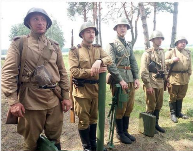
Военно-исторический клуб «Доблесть»