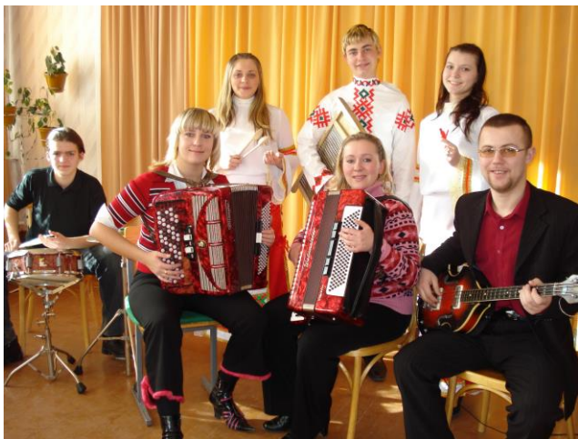
Оркестр «Фантазия» – бронзовый лауреат VI Международного молодёжного фестиваля национальных культур «Невские встречи» (г. Санкт-Петербург, 2011)

К услугам обучающихся на факультете – общежитие, спортивно-оздоровительный комплекс, специализированные кабинеты и лаборатории, позволяющие раскрыть творческие способности на основе выполнения курсовых и дипломных работ, связанных с реальной учебной и производственной практикой.